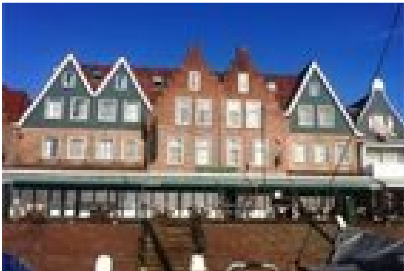
Hotel Old Dutch *** (Volendam)