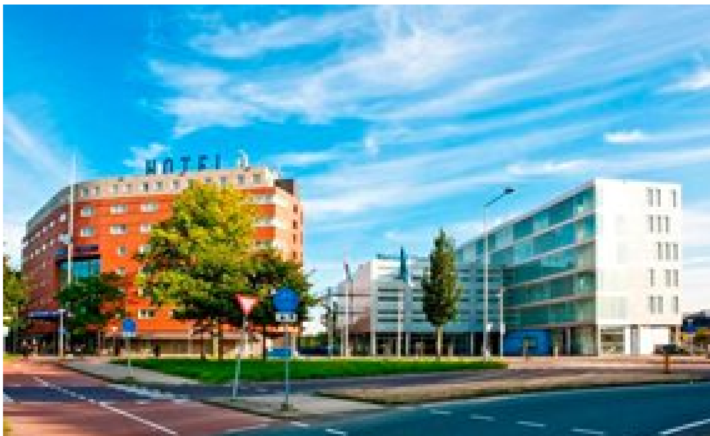
Westcord Art Hotel ***/**** (Amsterdam)

www.westcordhotels.nl/art-hotel-amsterdam