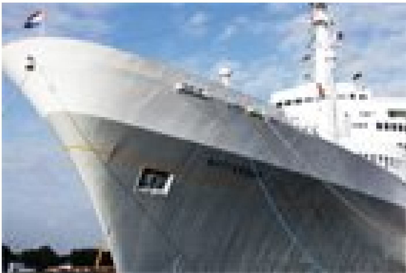
Westcord SS Rotterdam **** (Rotterdam)