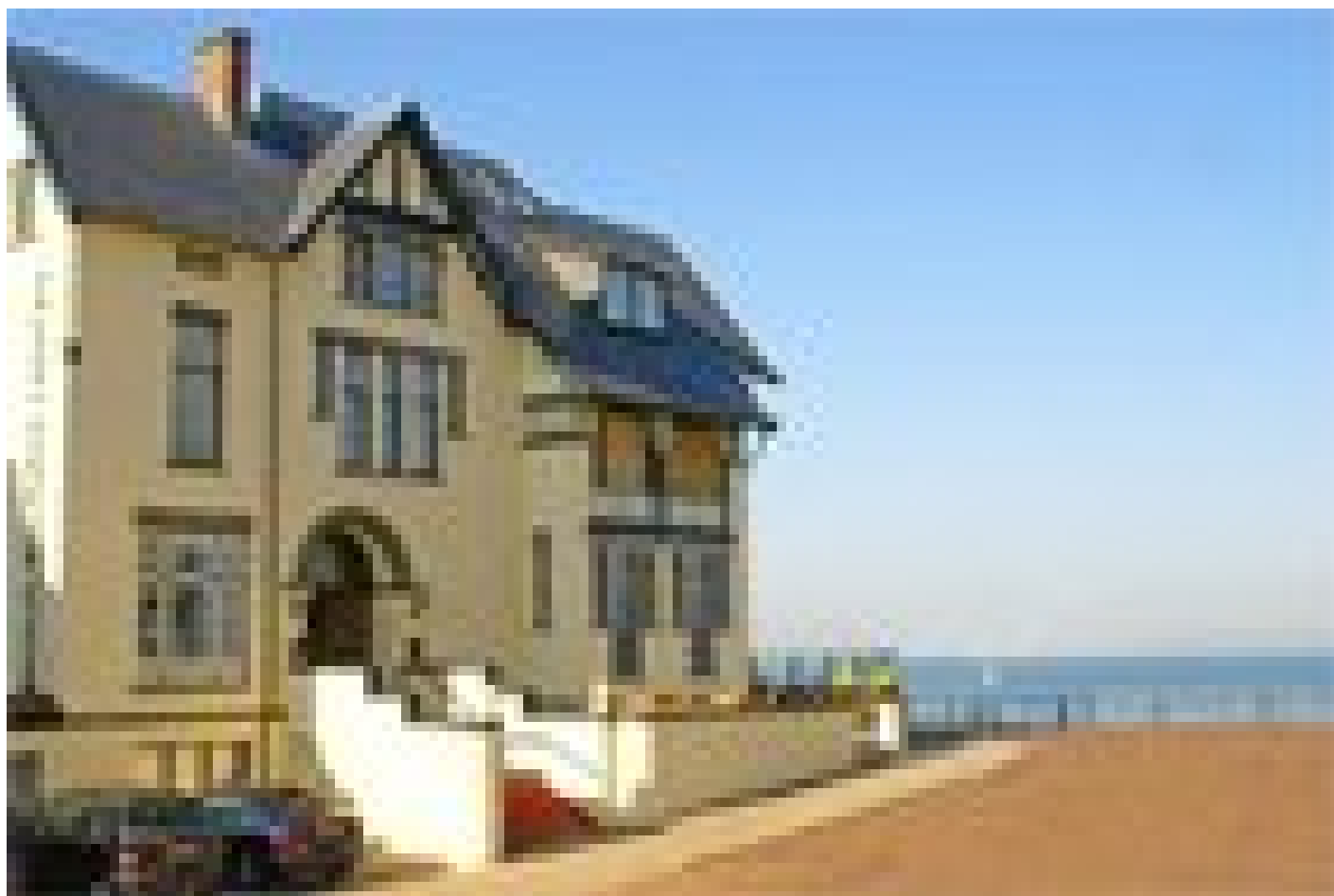
Boulevard Hotel *** (Scheveningen)