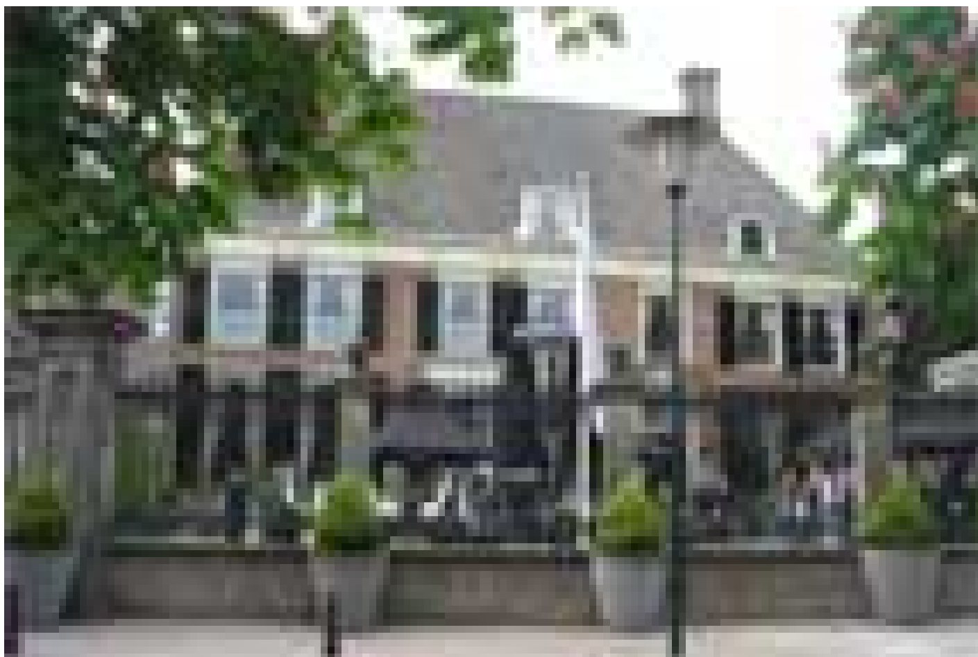
Hampshire Hotel - 's Gravenhof Zutphen **** (Zutphen)