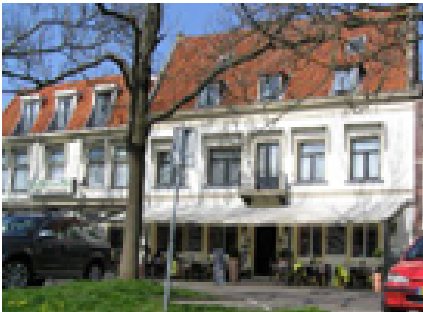
Hotel Restaurant Die Port van Cleve *** (Enkhuizen)