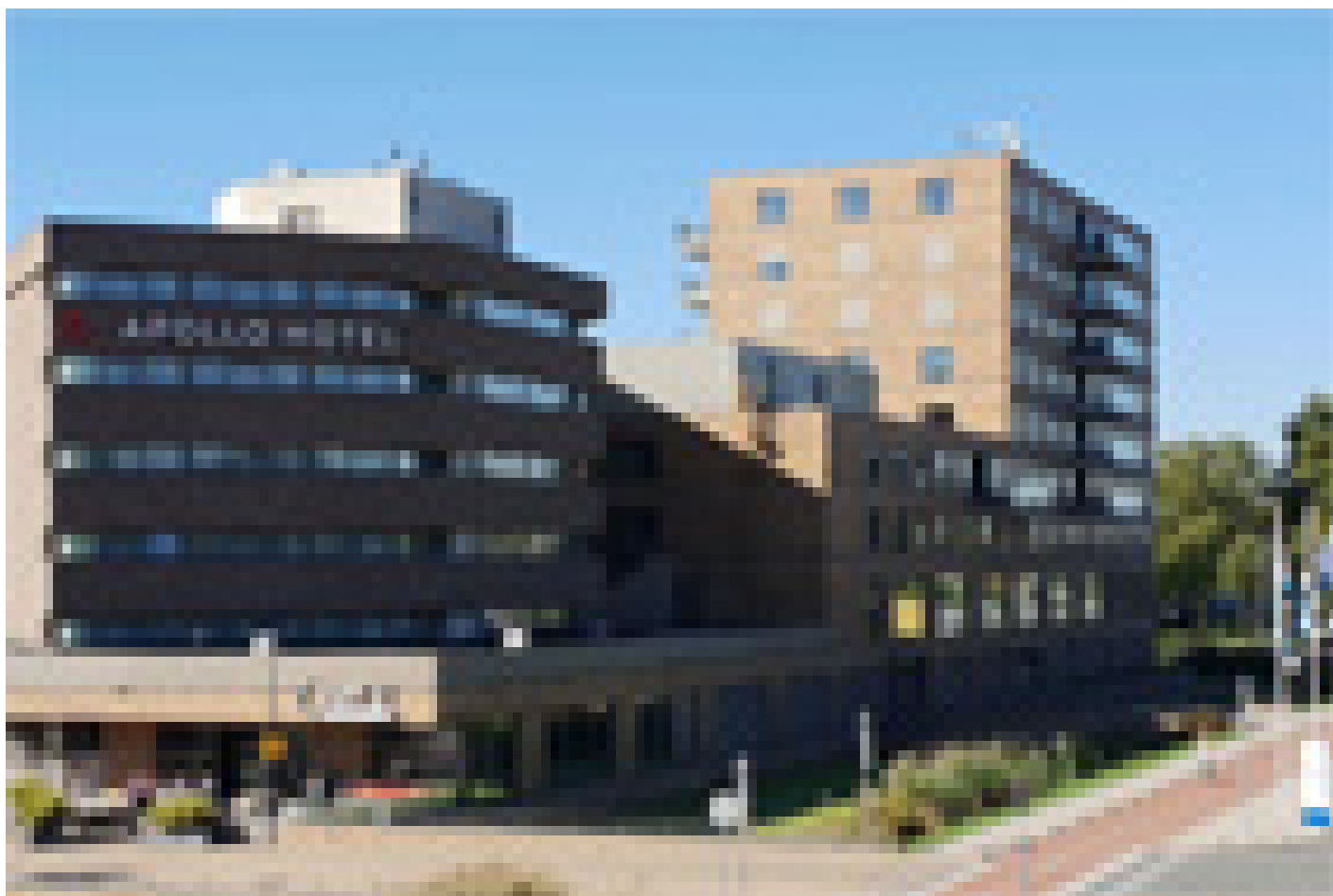
Leonardo Hotel Papendrecht **** (Papendrecht)