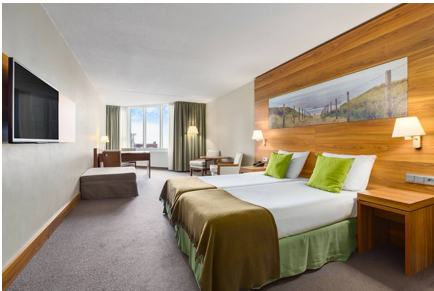
NH Zandvoort **** (Zandvoort)

https://www.nh-hotels.com/nl/hotel/nh-zandvoort