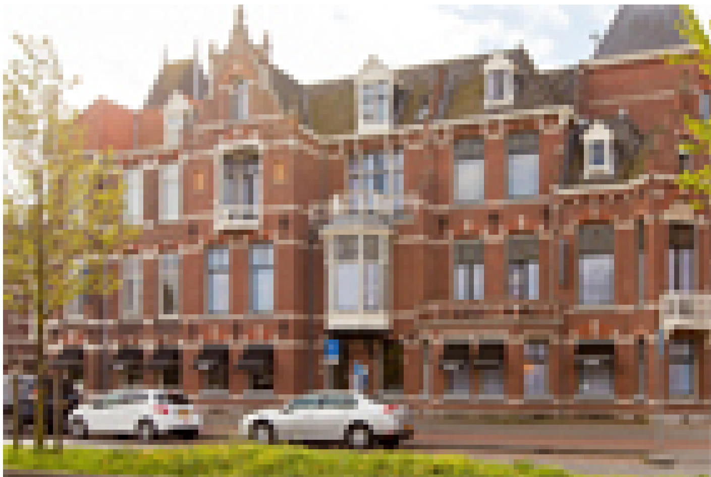
Best Western Hotel Den Haag *** (Den Haag)