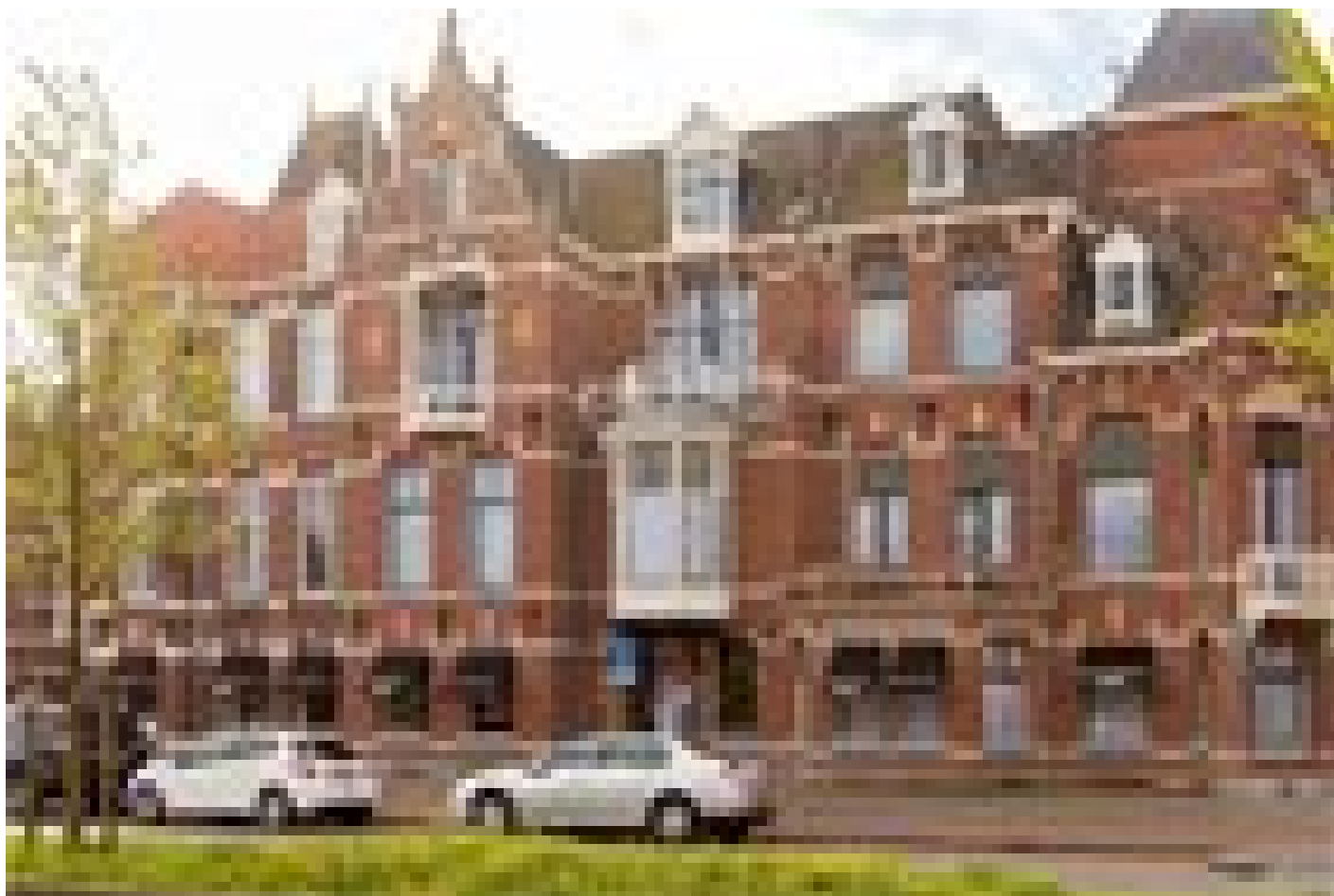
Best Western Hotel Den Haag *** (Den Haag)