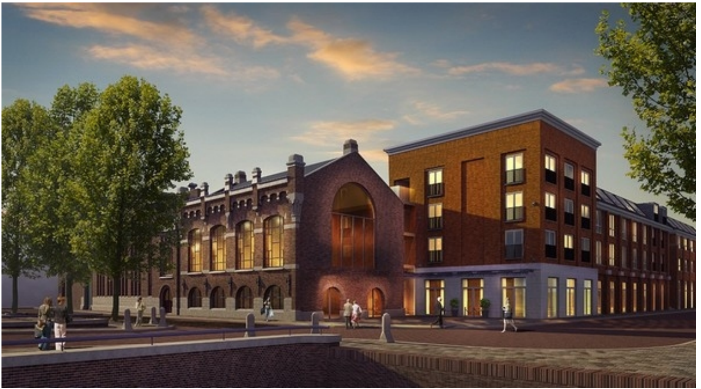
City Hotel Gouda **** (Gouda)