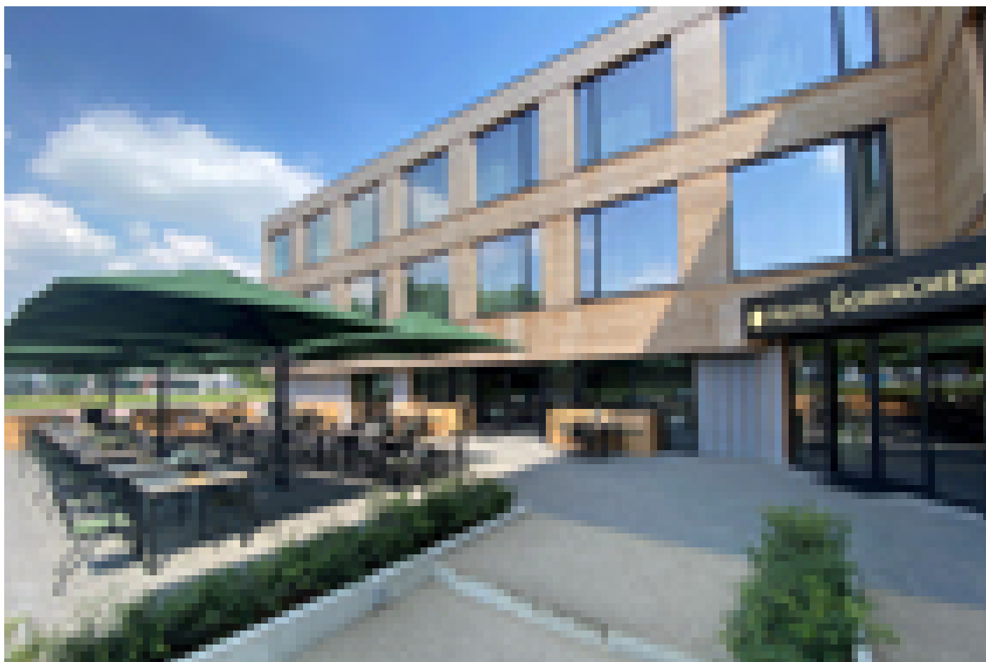
Hotel Gorinchem *** (Gorinchem)