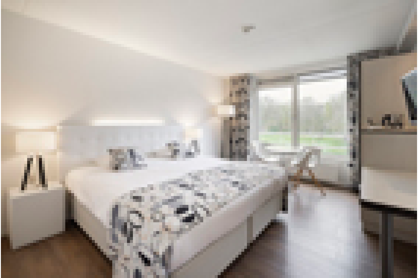
Hotel Mitland **** (Utrecht)

Quando selezioniamo gli hotel, verifichiamo che abbiano un deposito biciclette sicuro e al chiuso. Tuttavia, questo non è sempre possibile, dipende da hotel a hotel e dal numero di biciclette depositate dagli altri ospiti della struttura.