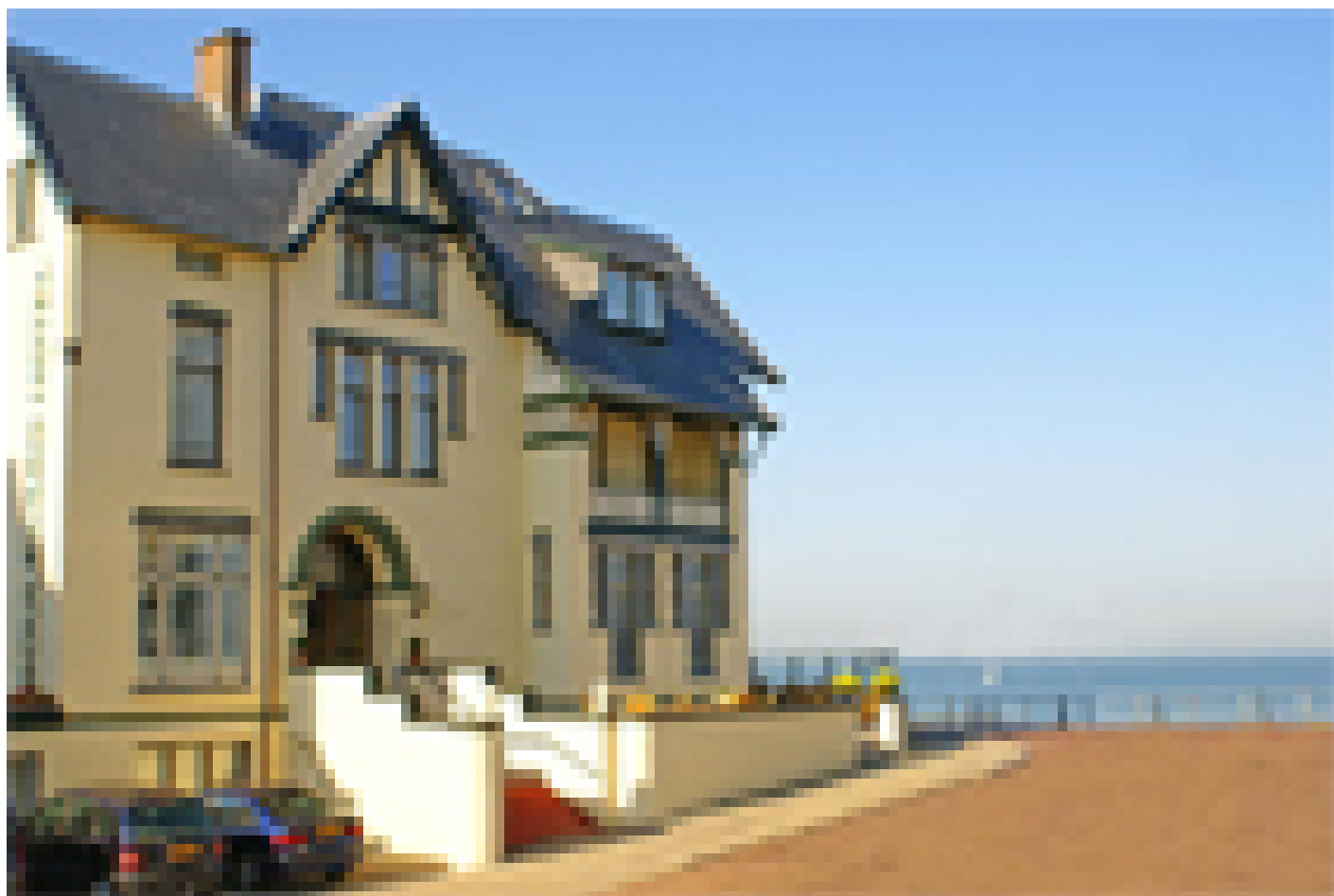
Boulevard Hotel *** (Scheveningen)