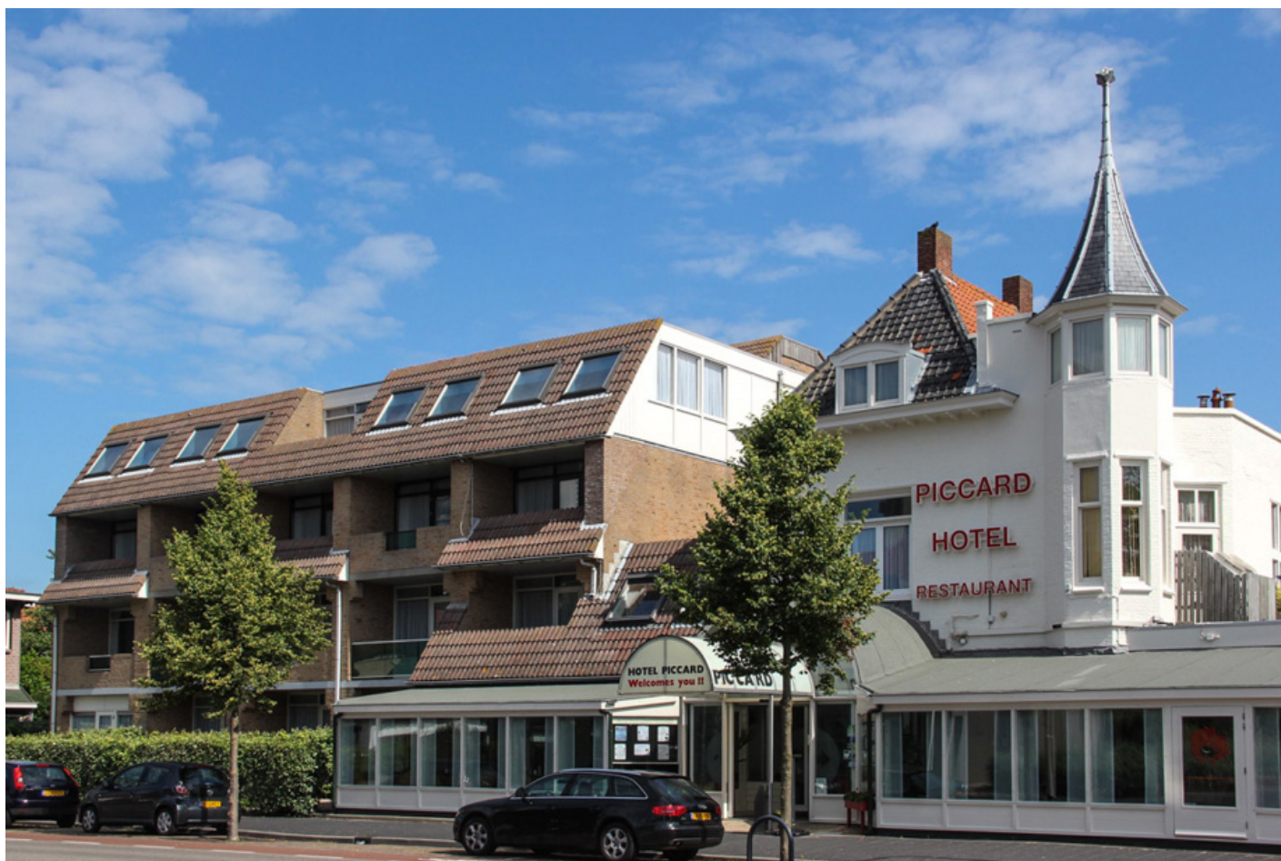
Hotel Piccard **** (Vlissingen)