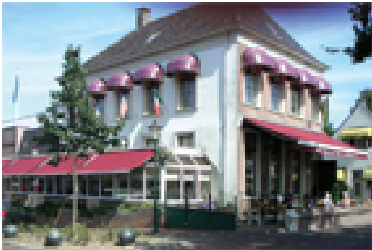
Hotel Medemblik *** (Medemblik)