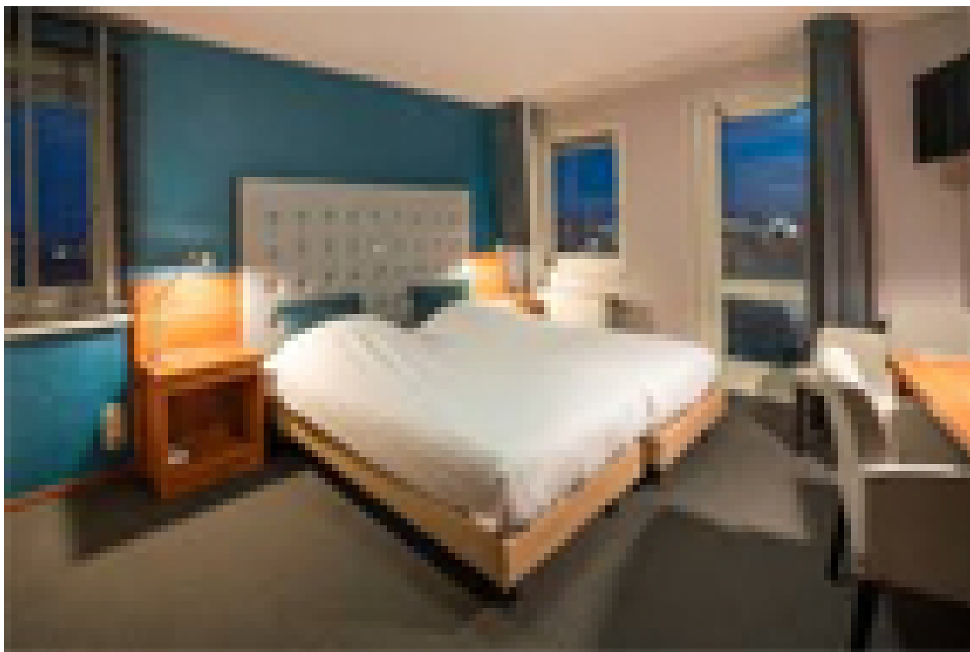
Hotel Lands End *** (Den Helder)