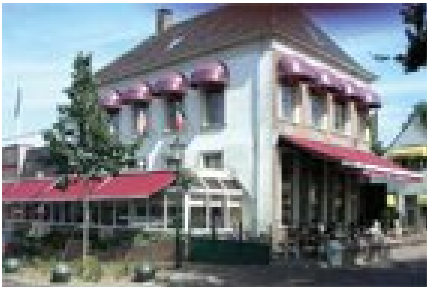
Hotel Medemblik *** (Medemblik)