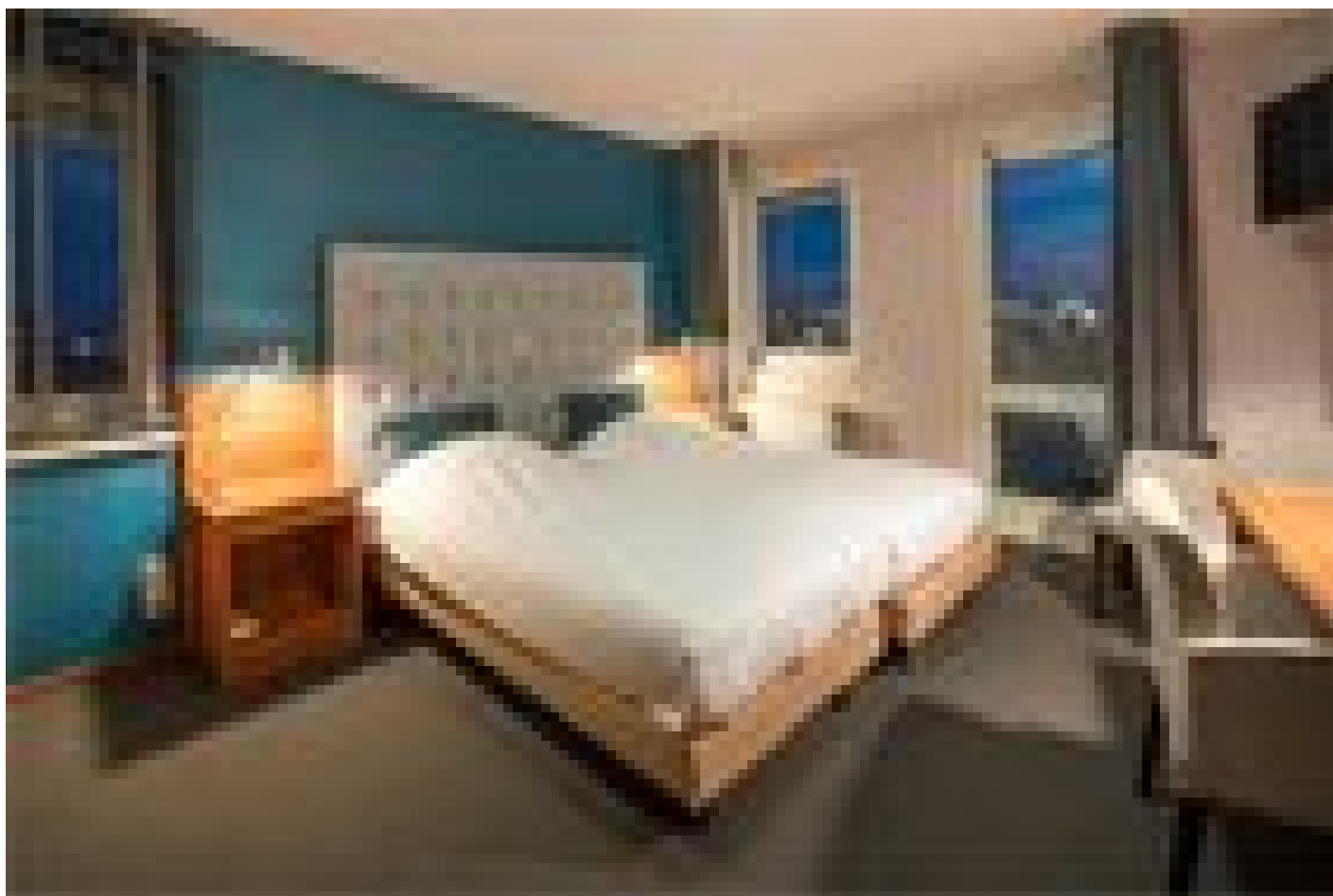
Hotel Lands End *** (Den Helder)