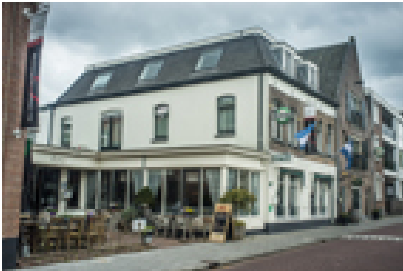
Hotel Hart van Weesp *** (Weesp)

Quando selezioniamo gli hotel, verifichiamo che abbiano un deposito biciclette sicuro e al chiuso. Tuttavia, questo non è sempre possibile, dipende da hotel a hotel e dal numero di biciclette depositate dagli altri ospiti della struttura.