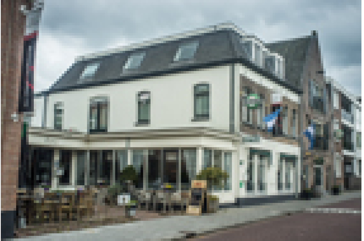
Hotel Hart van Weesp *** (Weesp)

Quando selezioniamo gli hotel, verifichiamo che abbiano un deposito biciclette sicuro e al chiuso. Tuttavia, questo non è sempre possibile, dipende da hotel a hotel e dal numero di biciclette depositate dagli altri ospiti della struttura.