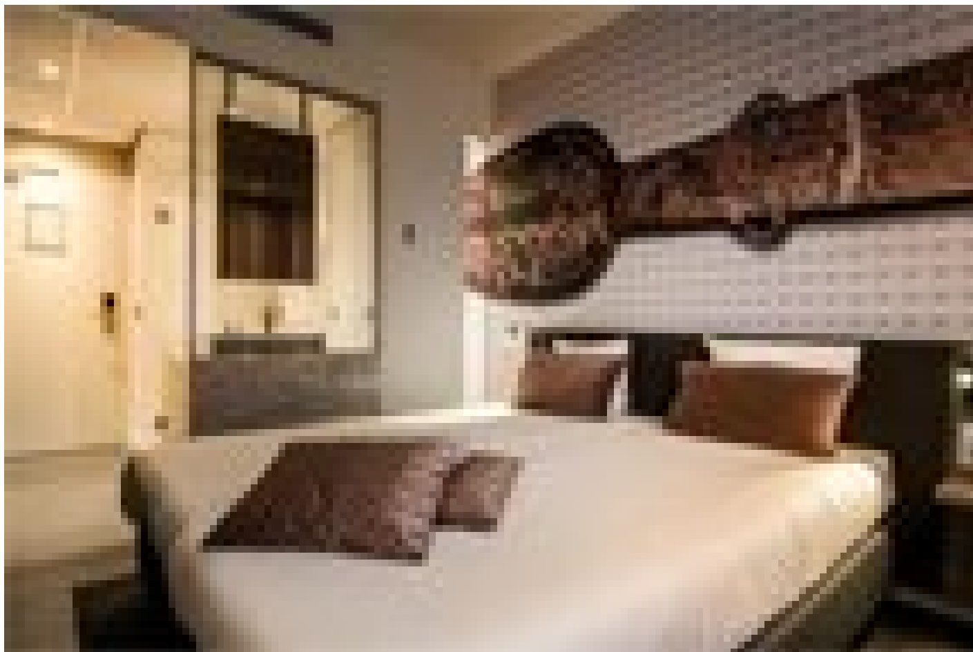
Tulip Inn Leiden Centre *** (Leiden)

www.goldengreenhotels.nl/golden-tulip-en-tulip-inn-leiden/