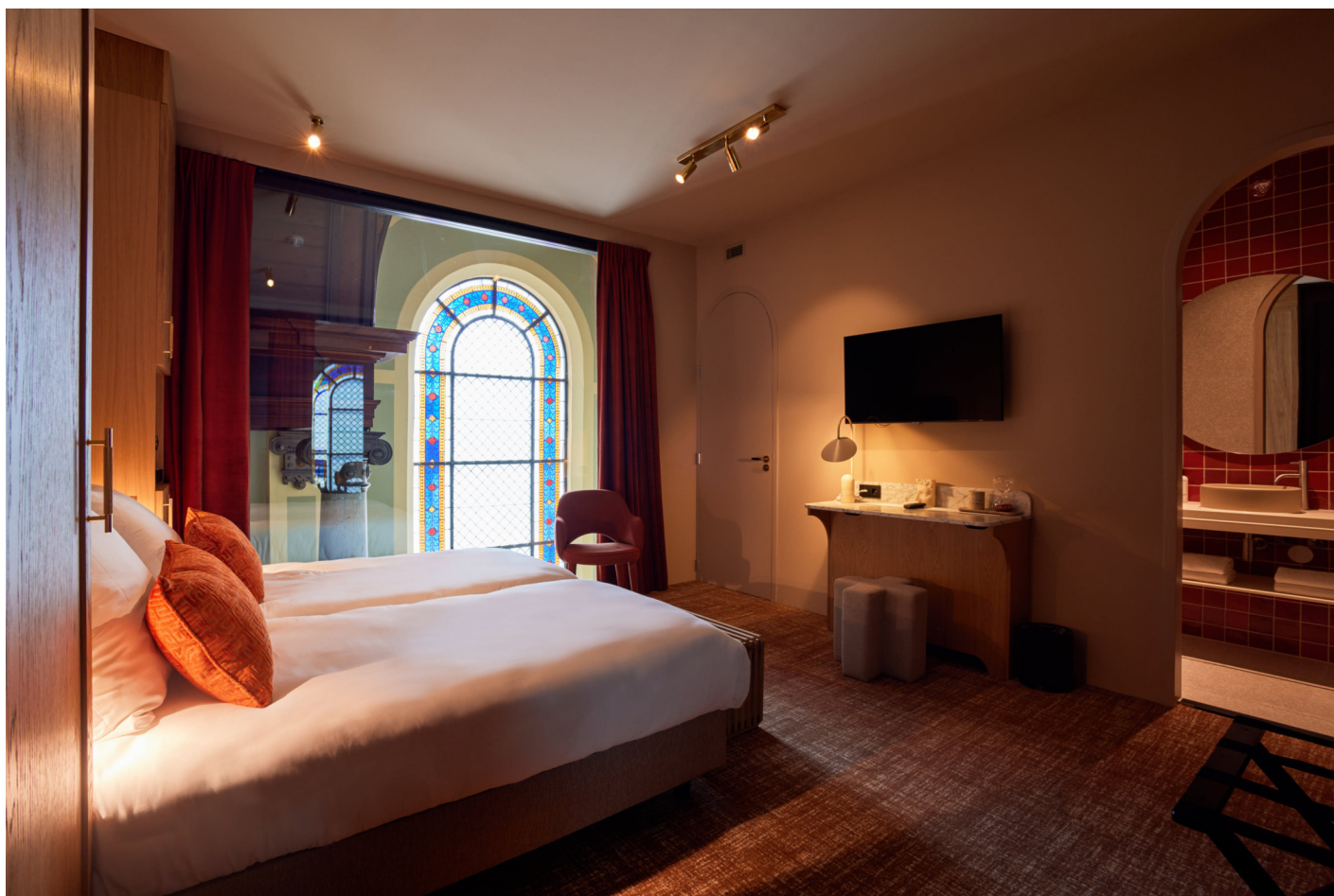
Heavens Hotel Hoorn **** (Hoorn)