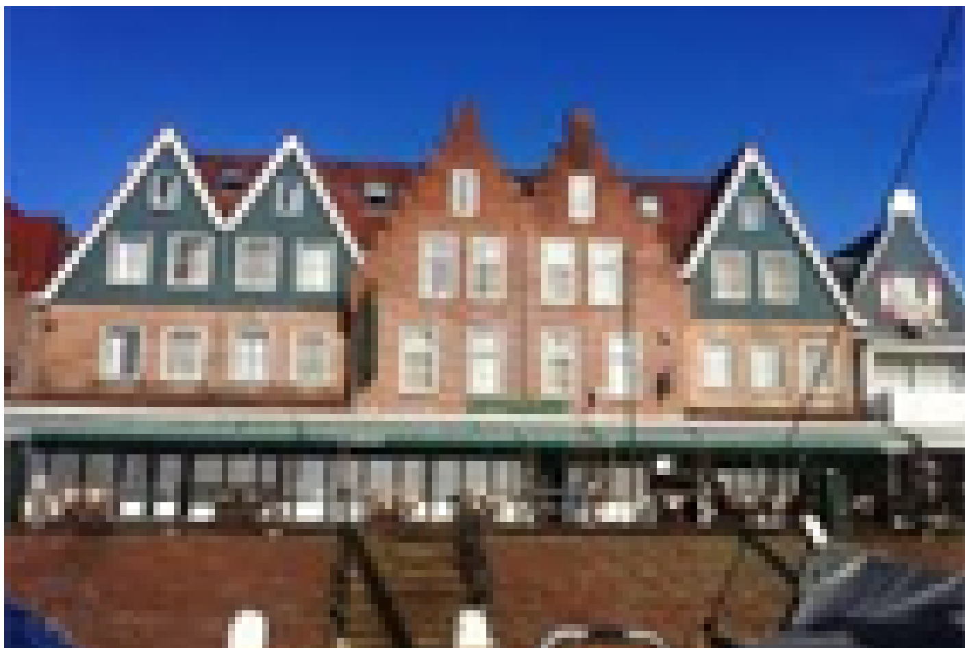
Hotel Old Dutch *** (Volendam)