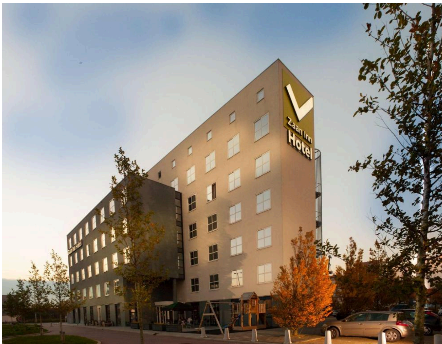
Best Western Zaan Inn *** (Zaandam)