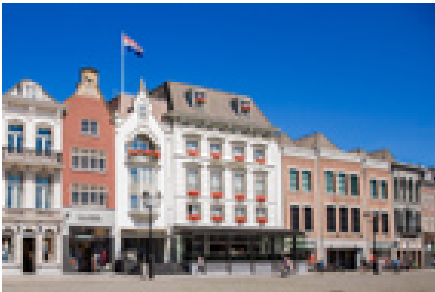
Golden Tulip Hotel Central **** ('s Hertogenbosch)