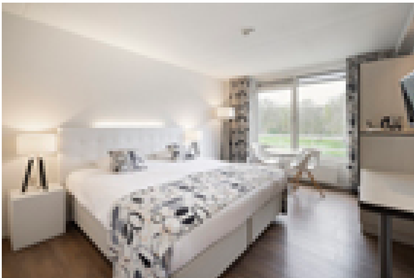
Hotel Mitland **** (Utrecht)