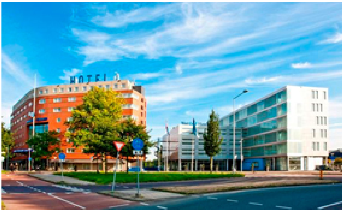
Westcord Art Hotel ***/**** (Amsterdam)

Quando selezioniamo gli hotel, verifichiamo che abbiano un deposito biciclette sicuro e al chiuso. Tuttavia, questo non è sempre possibile, dipende da hotel a hotel e dal numero di biciclette depositate dagli altri ospiti della struttura.