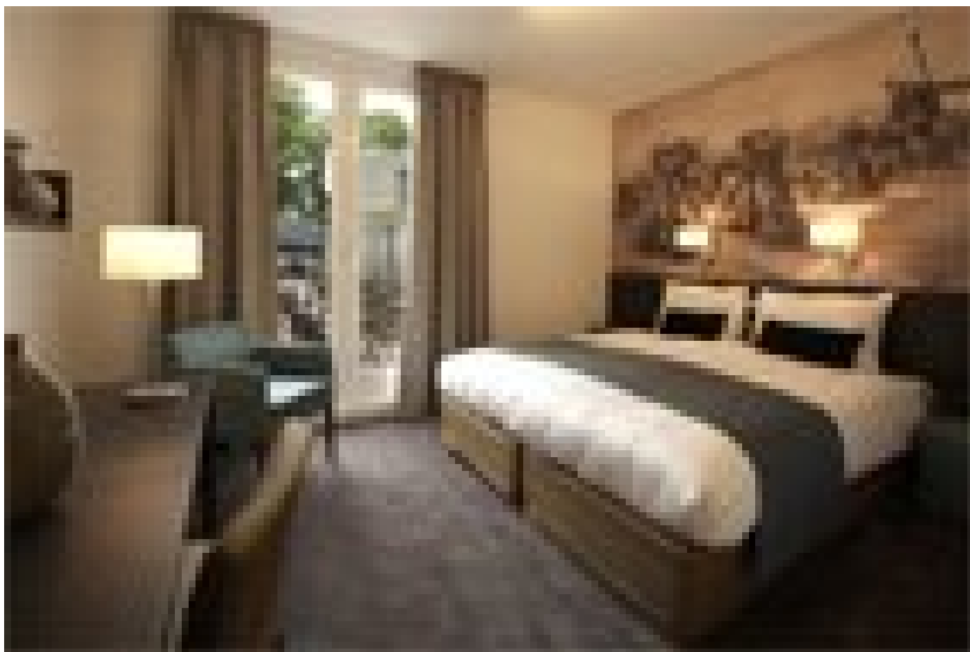
Parkhotel Auberge Vincent *** (Nuenen)