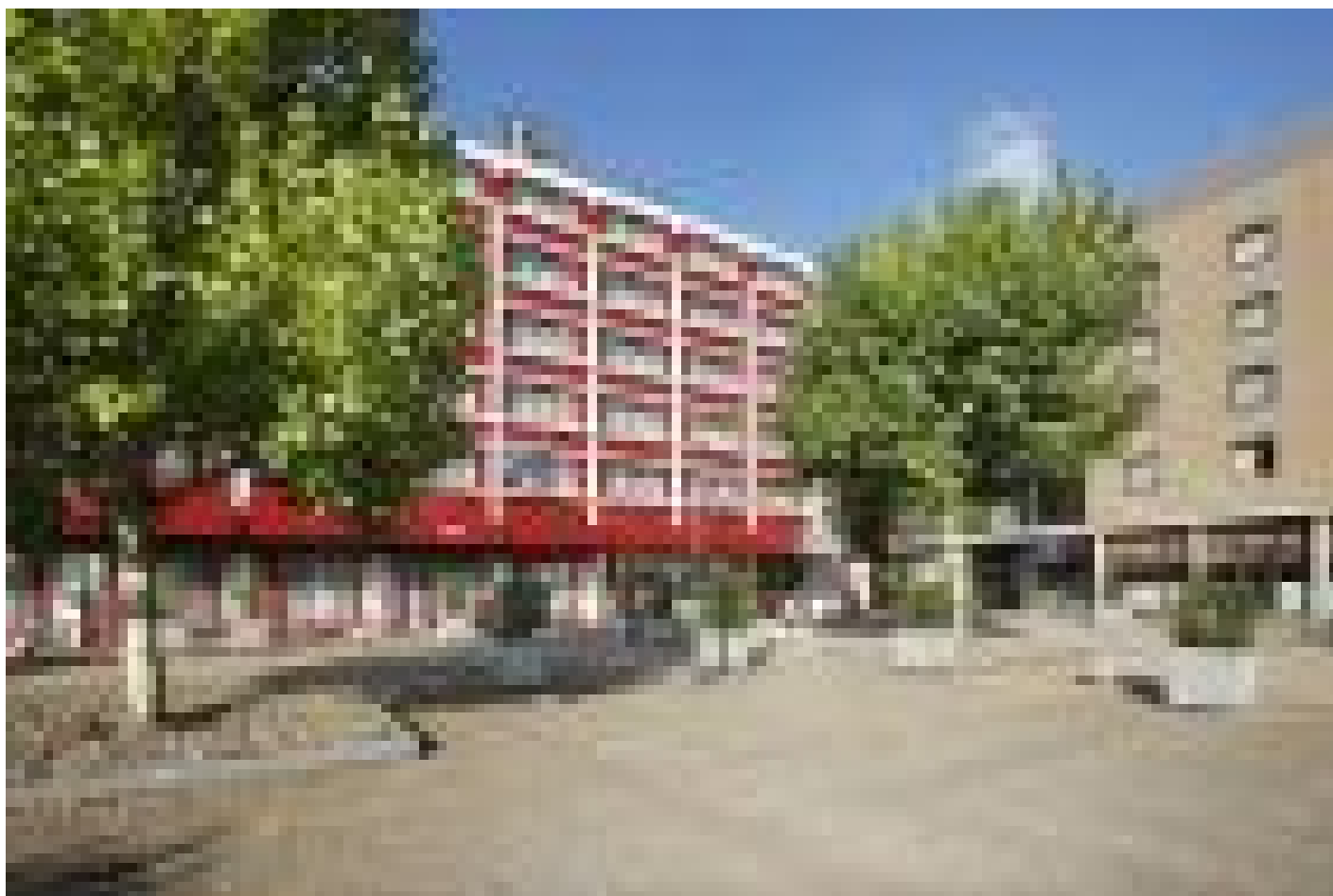
Hotel NH Maastricht **** (Maastricht)