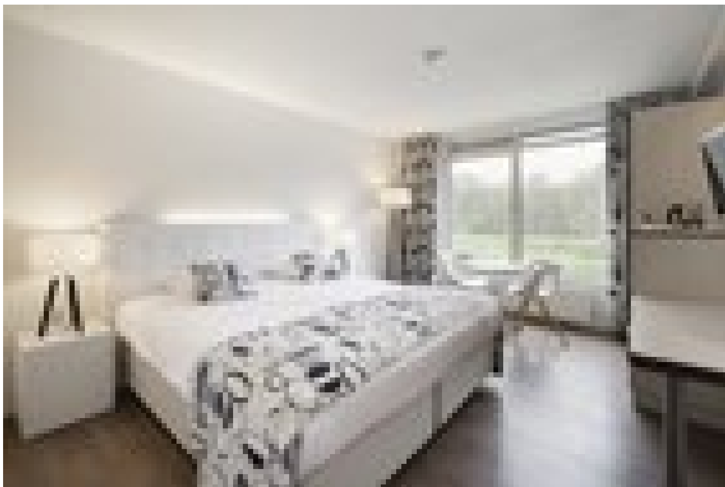
Hotel Mitland **** (Utrecht)