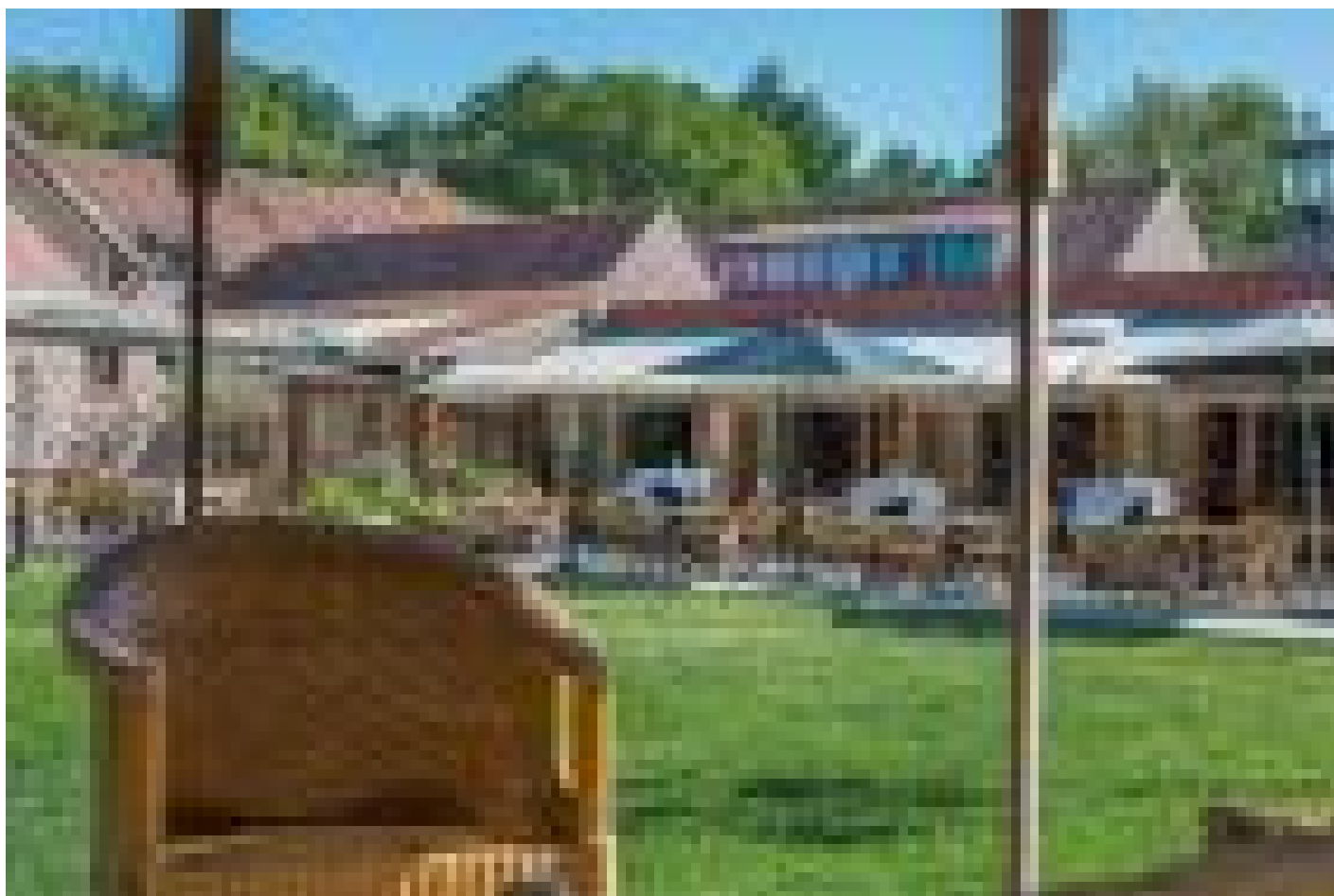
Hotel Restaurant de Roosterhoeve**** (Roosteren)