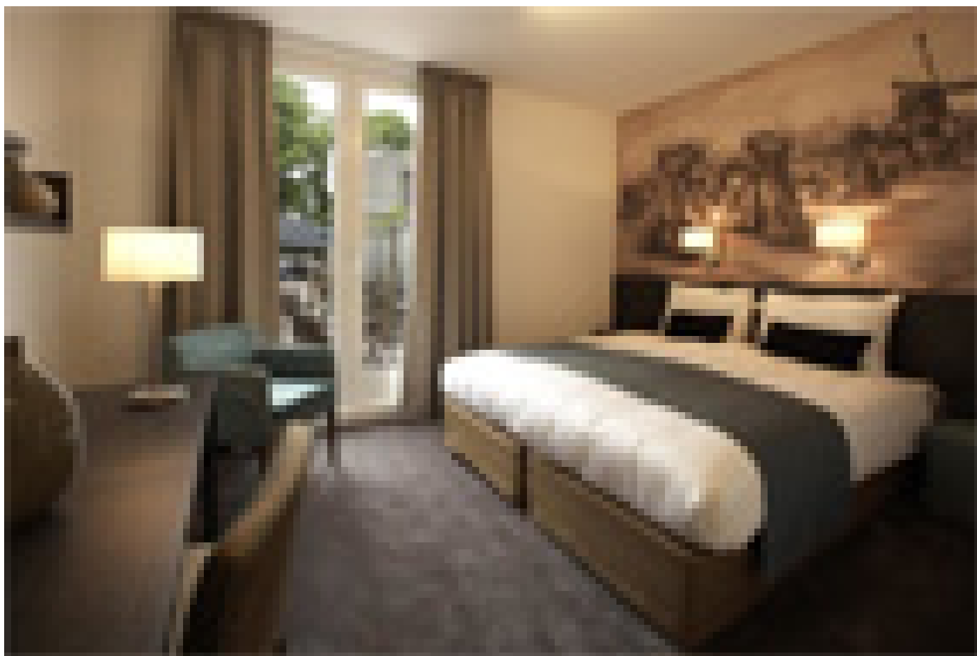
Parkhotel Auberge Vincent *** (Nuenen)