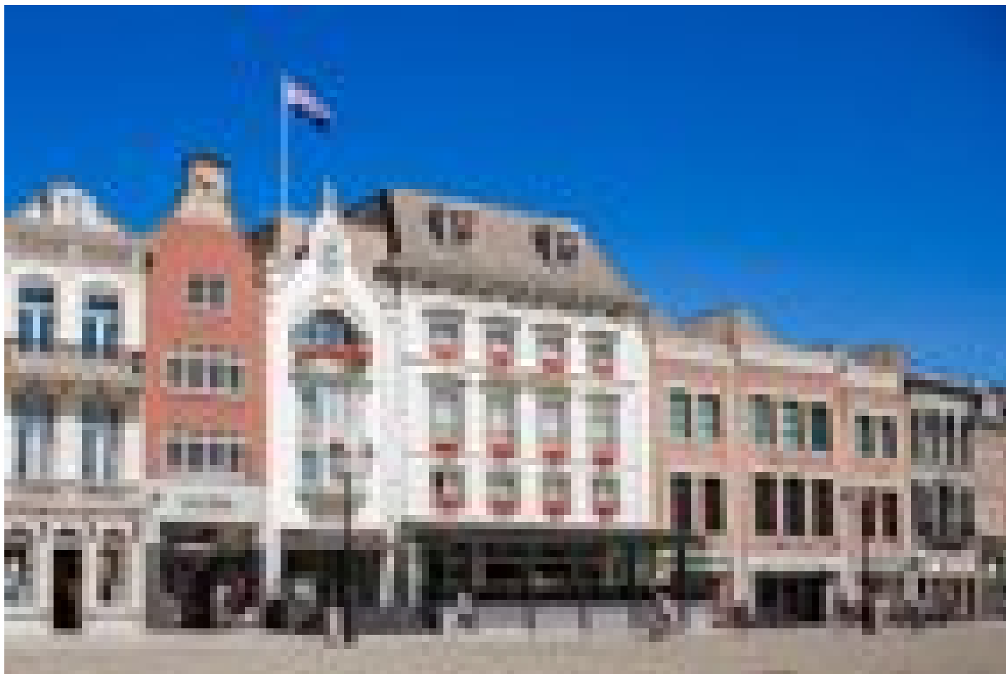
Golden Tulip Hotel Central **** ('s Hertogenbosch)