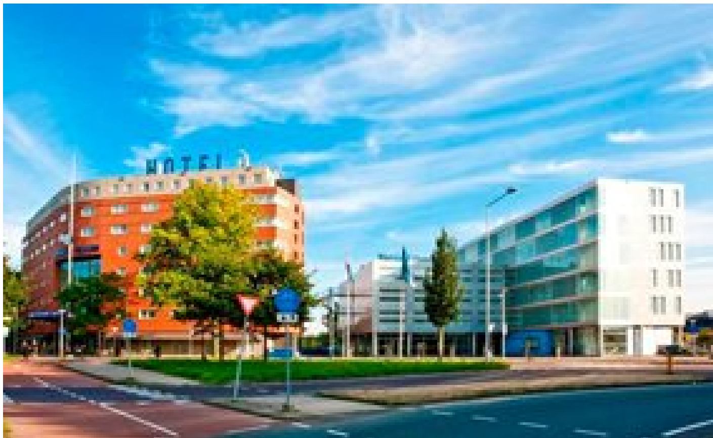
Westcord Art Hotel ***/**** (Amsterdam)

Quando selezioniamo gli hotel, verifichiamo che abbiano un deposito biciclette sicuro e al chiuso. Tuttavia, questo non è sempre possibile, dipende da hotel a hotel e dal numero di biciclette depositate dagli altri ospiti della struttura.