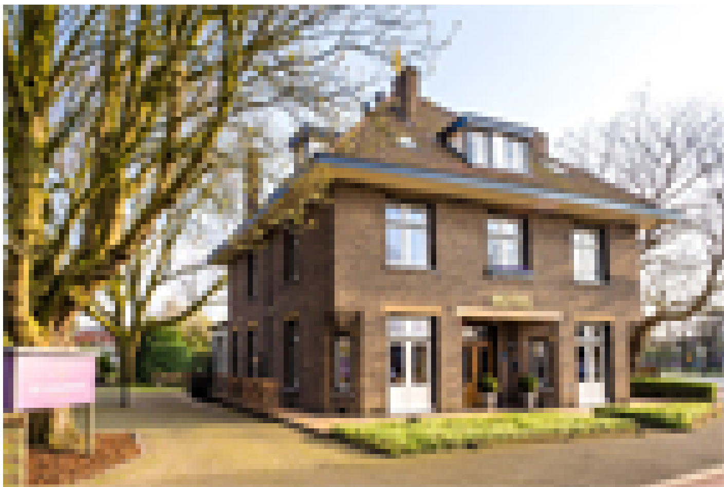
Breda - Boutique Hotel het Scheepshuys