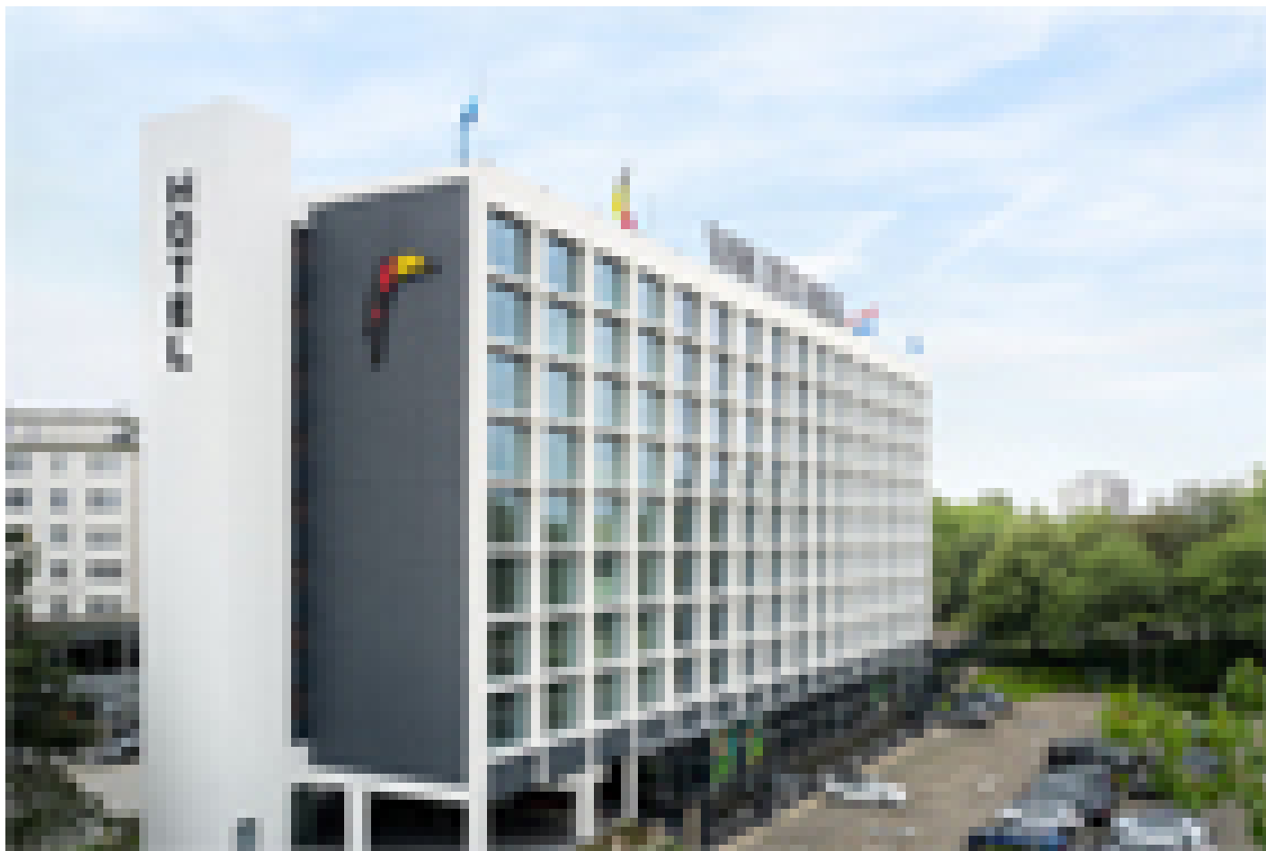
Antwerpen - Van der Valk