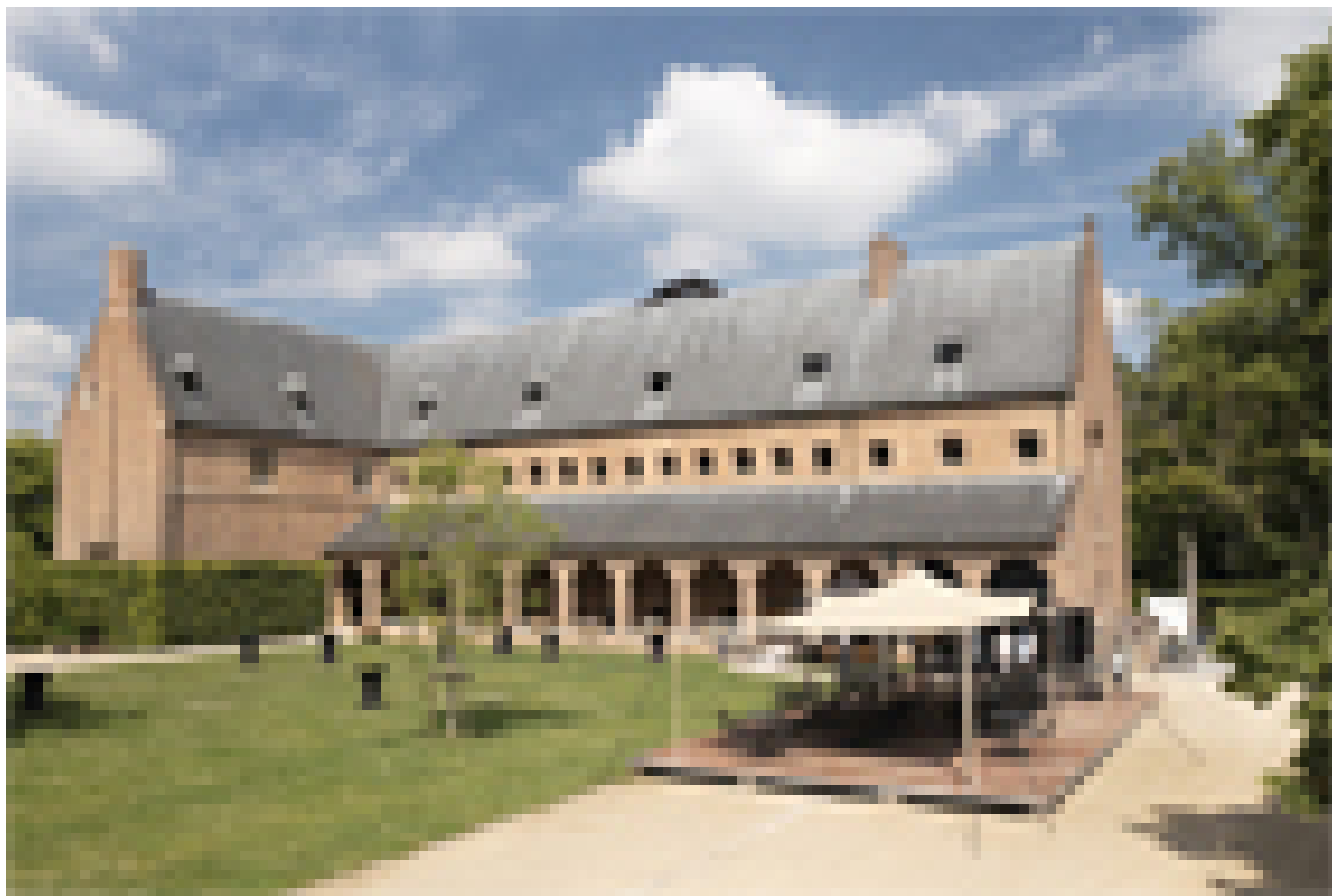
Turnhout - Priorij Corsendonk ***

Quando selezioniamo gli hotel, verifichiamo che abbiano un deposito biciclette sicuro e al chiuso. Tuttavia, questo non è sempre possibile, dipende da hotel a hotel e dal numero di biciclette depositate dagli altri ospiti della struttura.