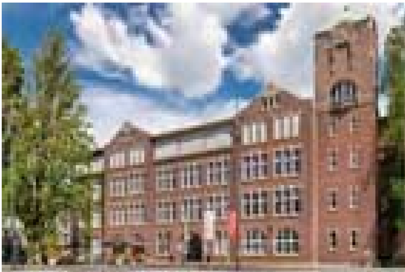
Stayokay Amsterdam Oost (Zeeburg) (Amsterdam)

www.stayokay.com/nl/hostel/amsterdam-oost