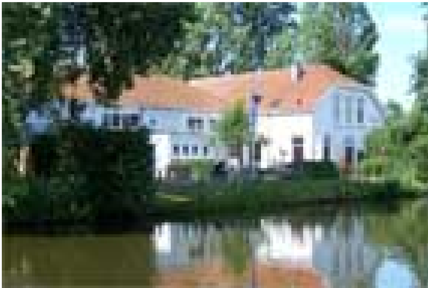
Stayokay Haarlem (Haarlem)

Quando selezioniamo gli hotel, verifichiamo che abbiano un deposito biciclette sicuro e al chiuso. Tuttavia, questo non è sempre possibile, dipende da hotel a hotel e dal numero di biciclette depositate dagli altri ospiti della struttura.