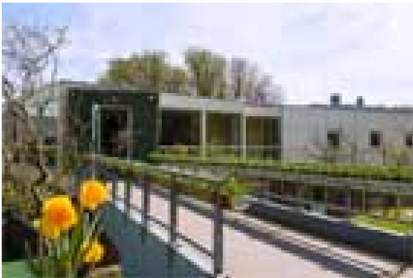
Stayokay Noordwijk (Noordwijk)