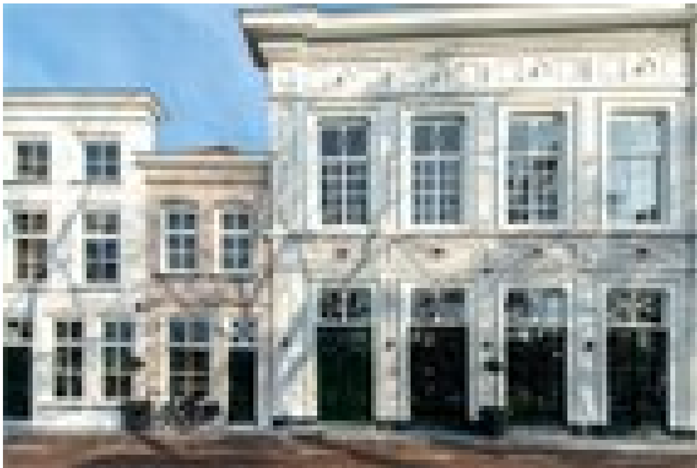
Hotel Mondragon (Zierikzee)