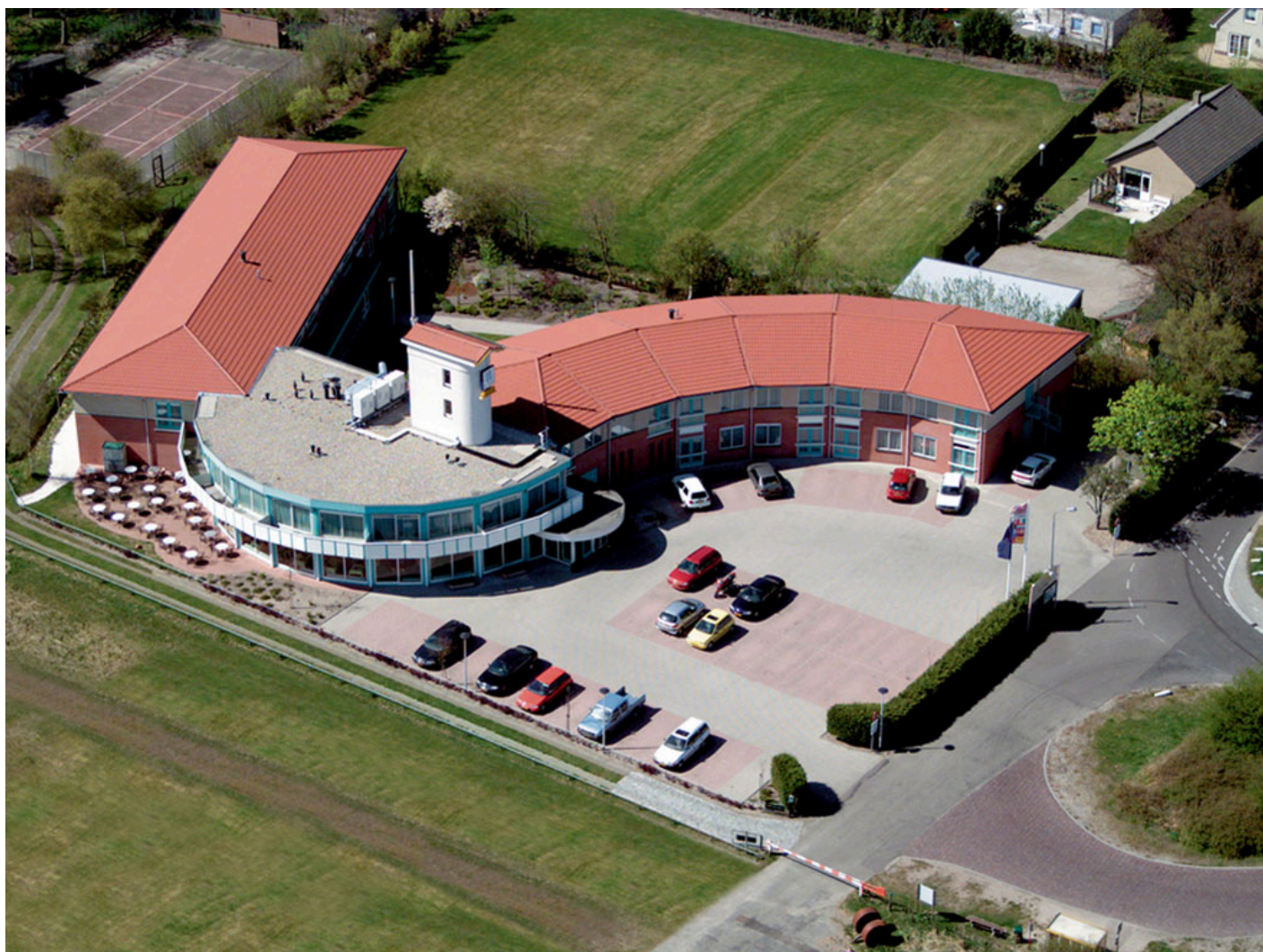
Fletcher Duinhotel Burgh Haamstede **** (Burgh Haamstede)