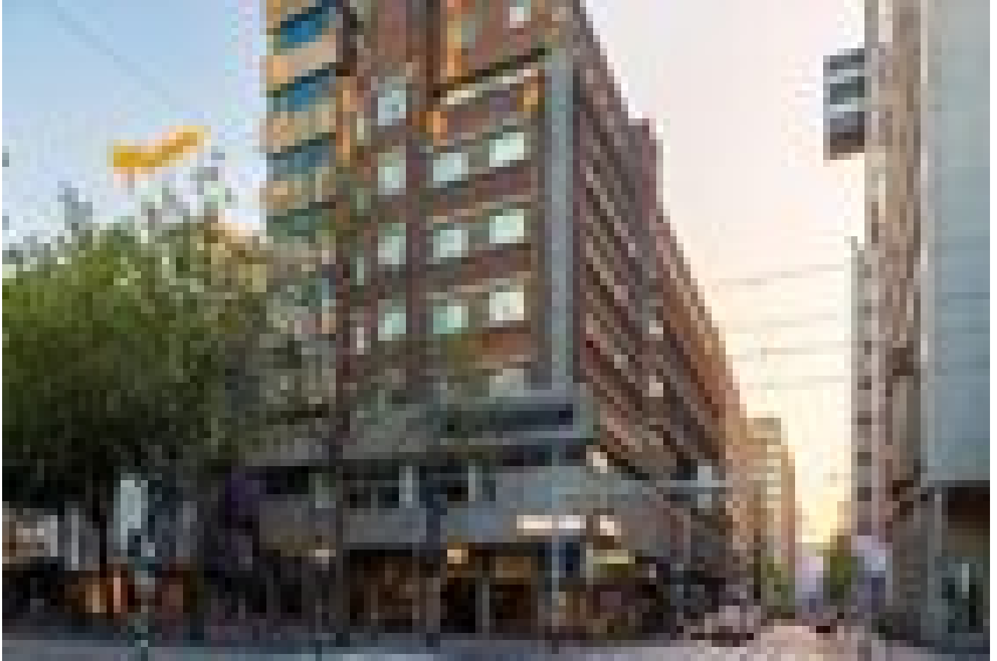
NH Hotel Atlanta Rotterdam **** (Rotterdam)

Quando selezioniamo gli hotel, verifichiamo che abbiano un deposito biciclette sicuro e al chiuso. Tuttavia, questo non è sempre possibile, dipende da hotel a hotel e dal numero di biciclette depositate dagli altri ospiti della struttura.