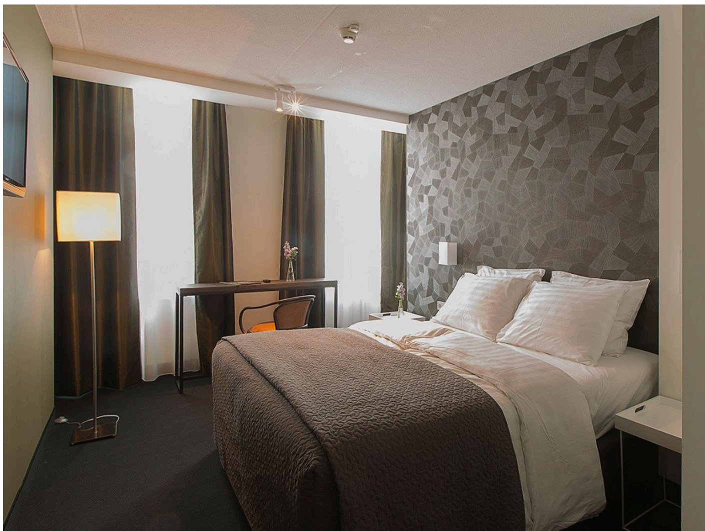
Hotel Mauritz *** (Willemstad)