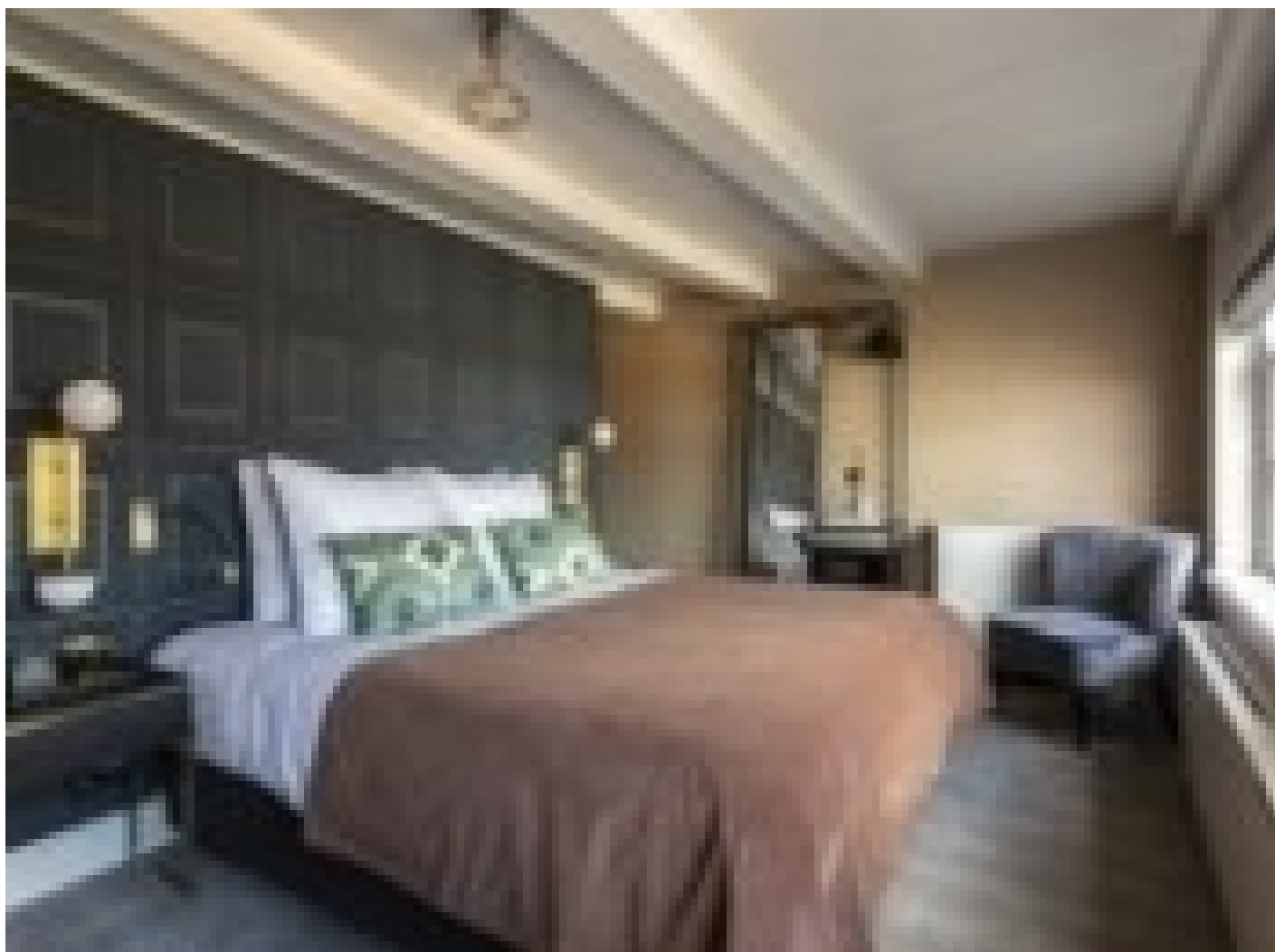
Boutique Hotel Poorter **** (Brielle)