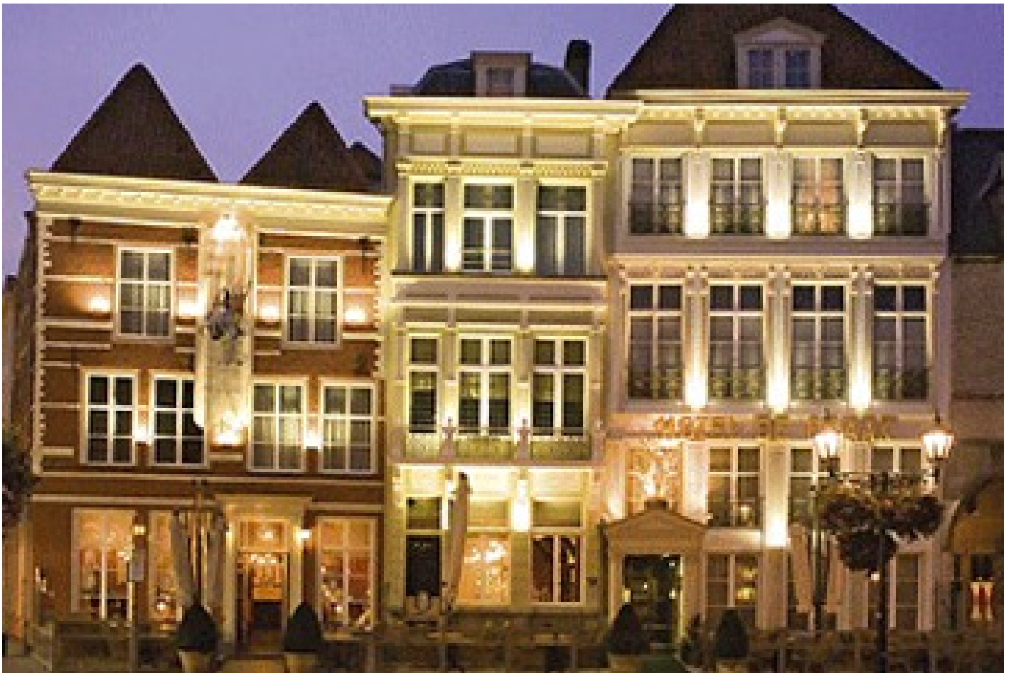
Grand Hotel De Draak **** (Bergen op Zoom)