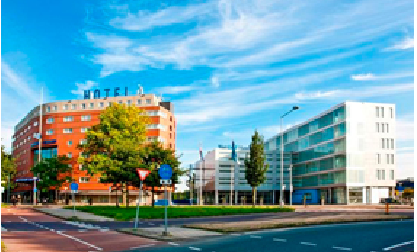
Westcord Art Hotel ***/**** (Amsterdam)

Quando selezioniamo gli hotel, verifichiamo che abbiano un deposito biciclette sicuro e al chiuso. Tuttavia, questo non è sempre possibile, dipende da hotel a hotel e dal numero di biciclette depositate dagli altri ospiti della struttura.